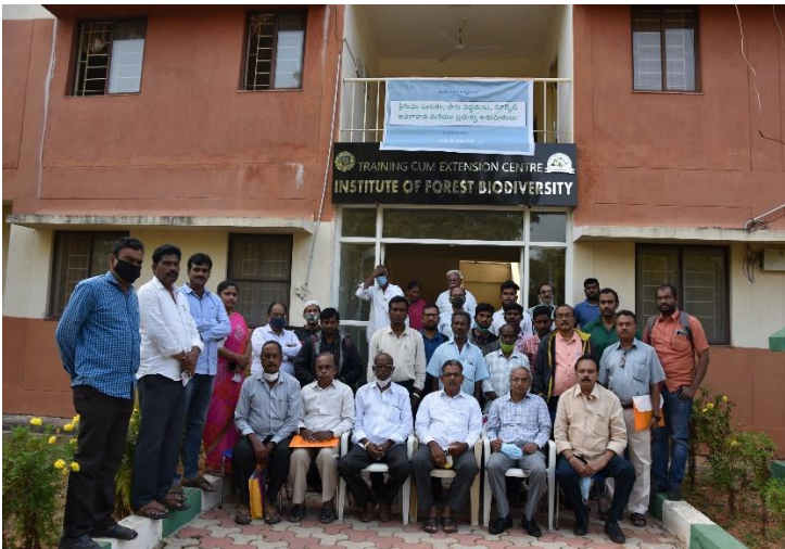
Training program group photograph at IFB