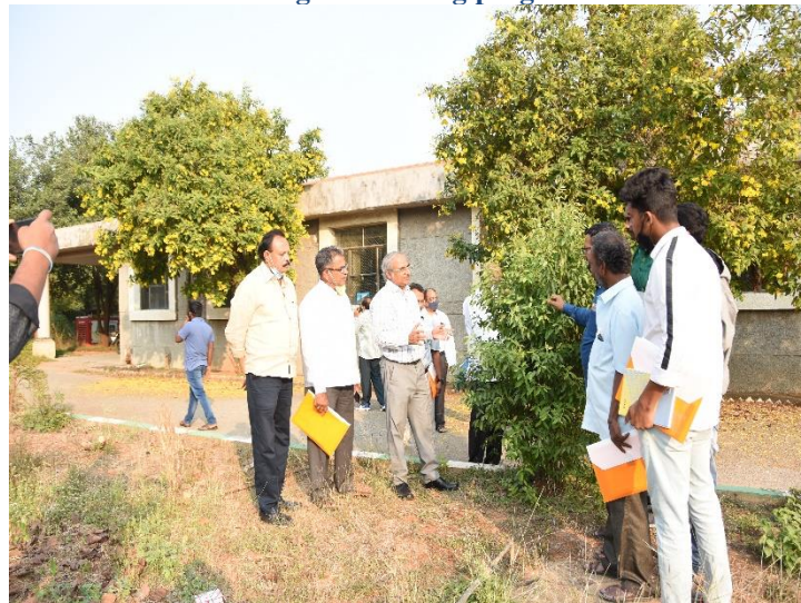
Field visit at IFB