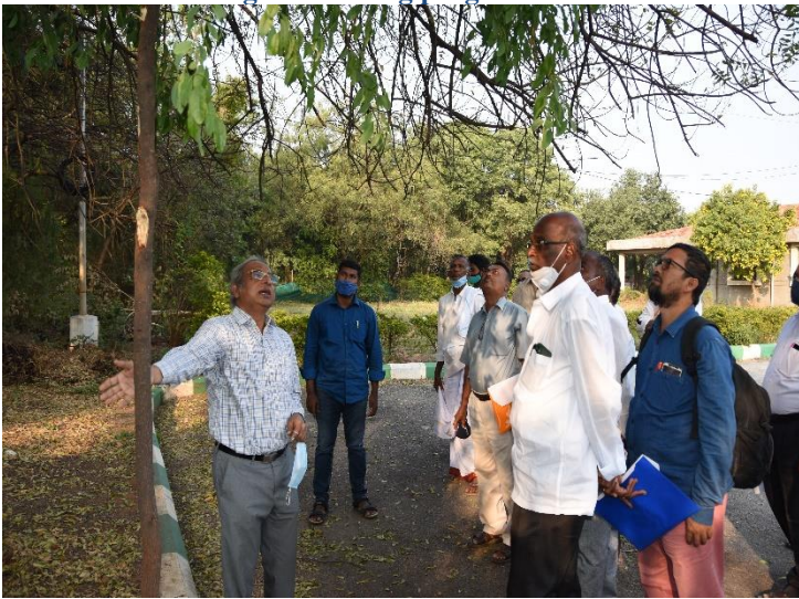
Field visit at IFB