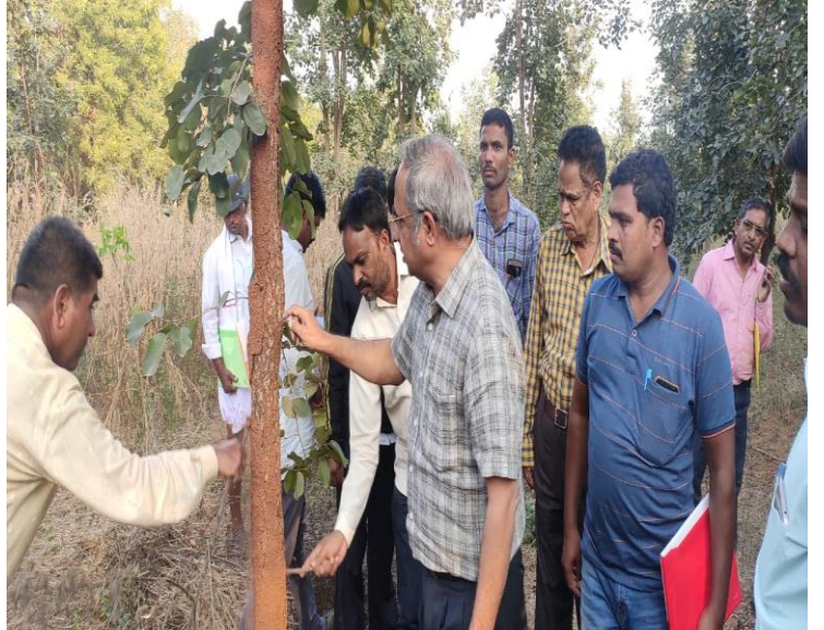
Field visit at IFB