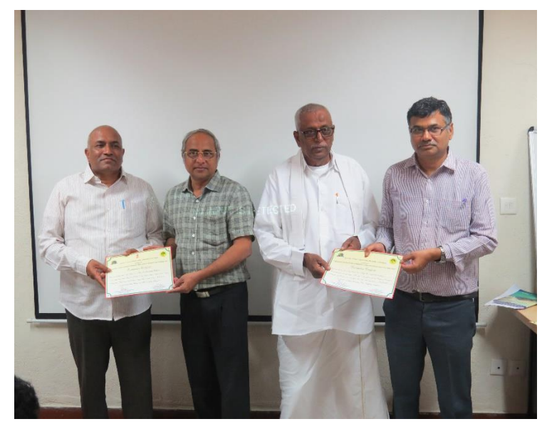
Distribution of Training certificates to farmers at IFB