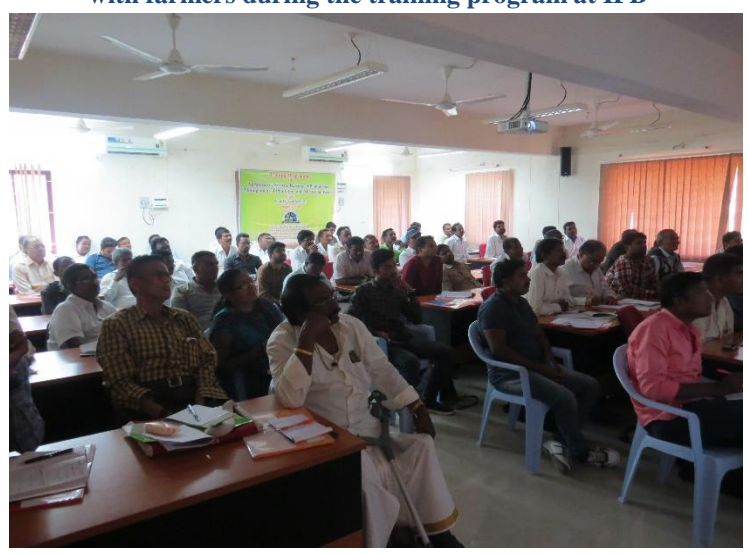
Classroom Session for farmers at IFB