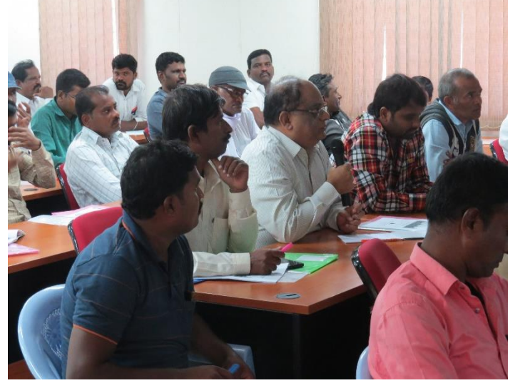
Farmers discussion during the training program at IFB