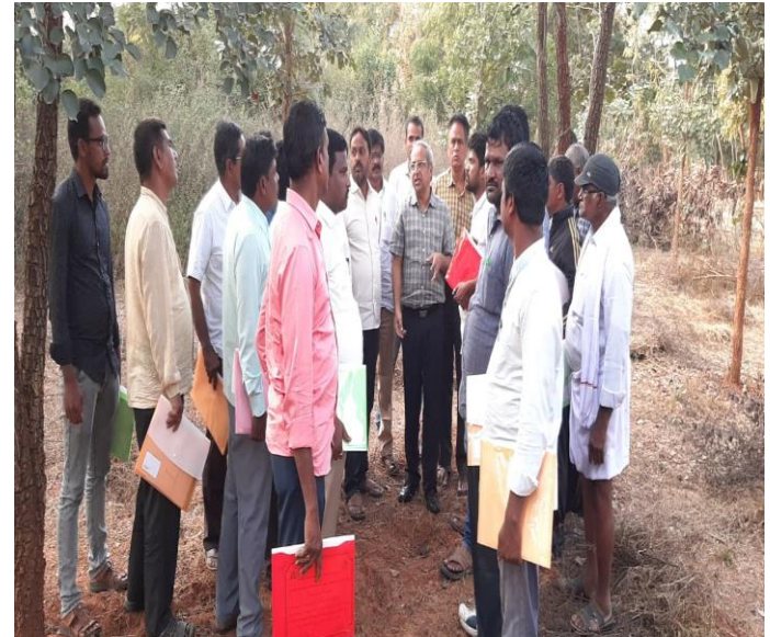
Field visit at IFB