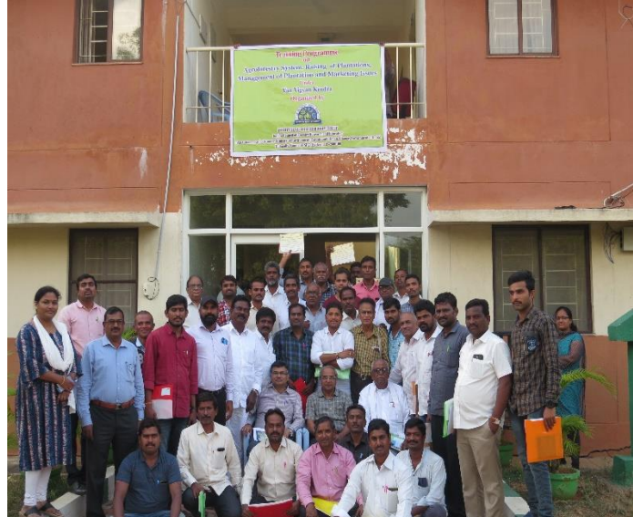
Training program group photograph at IFB