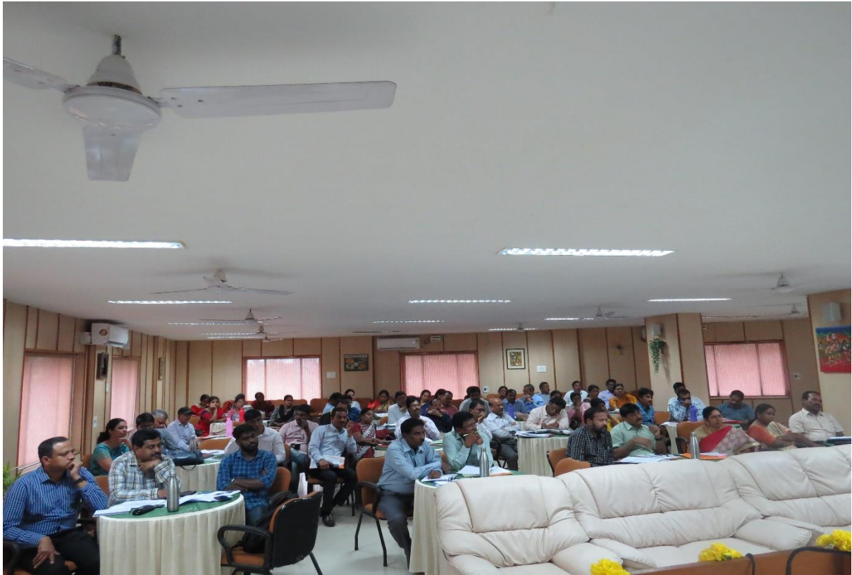
Dignitaries and participants of the workshop