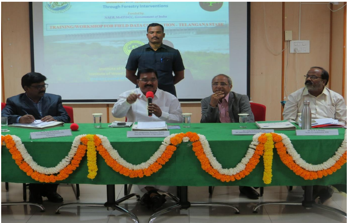
Dignitaries of the workshop