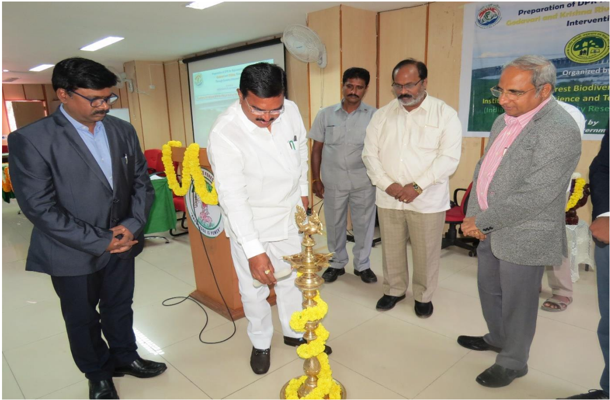
Inaugural lamp lighting by the Hon'ble Agriculture Minister Shri S. Nirajan Reddy