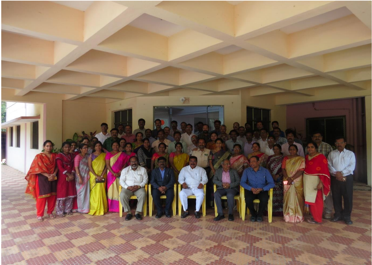
Group photo of officials of Agriculture & Horticulture departments with IFB officials