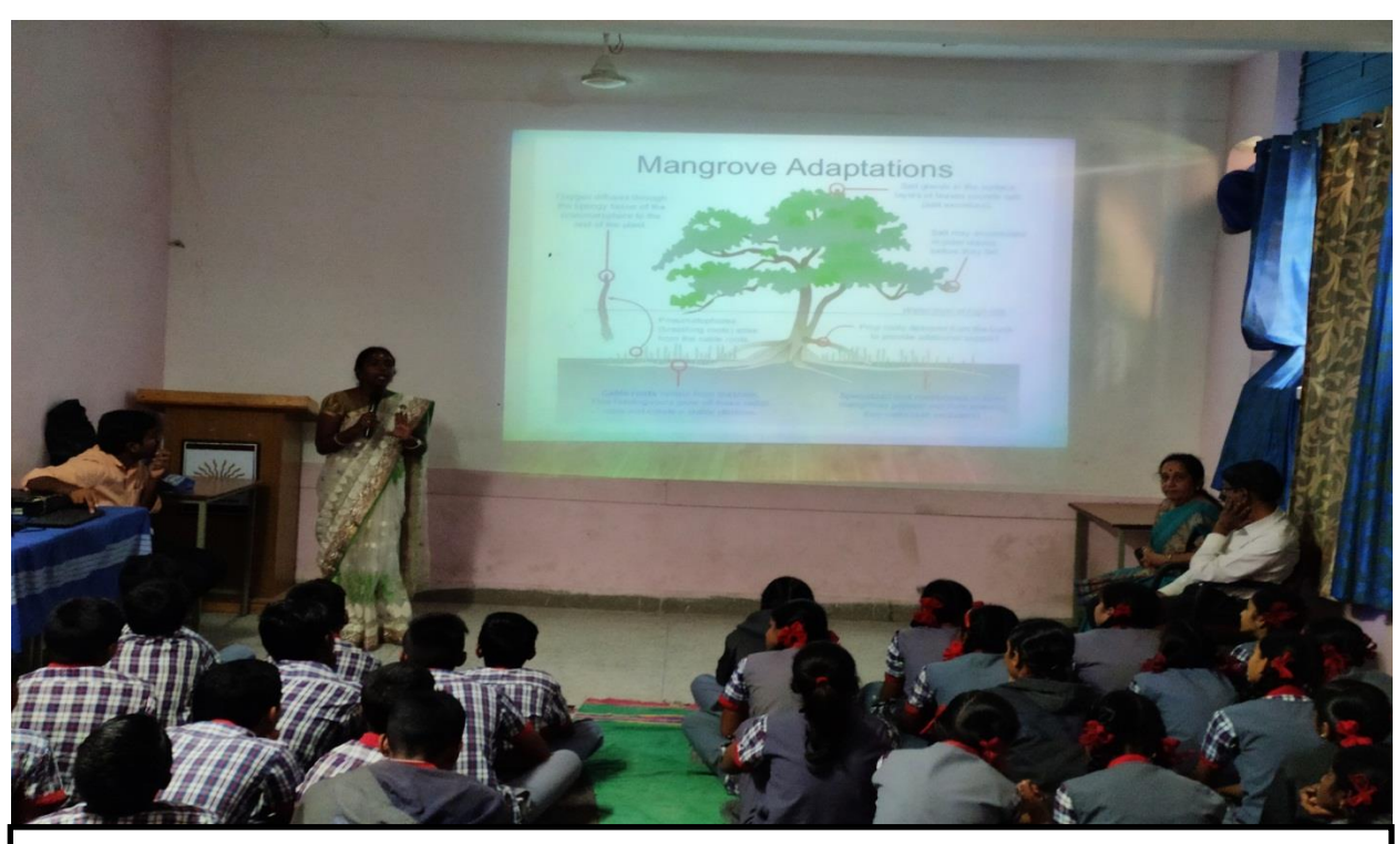
Students and Teachers of KVS, Gachibowli are in Classroom