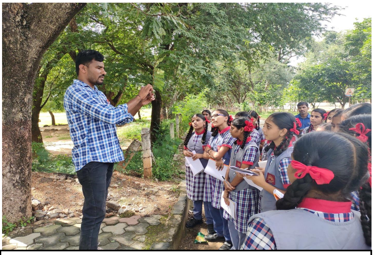
IFB Staff explaining about the plant identification toStudents of KVS, Gachibowli