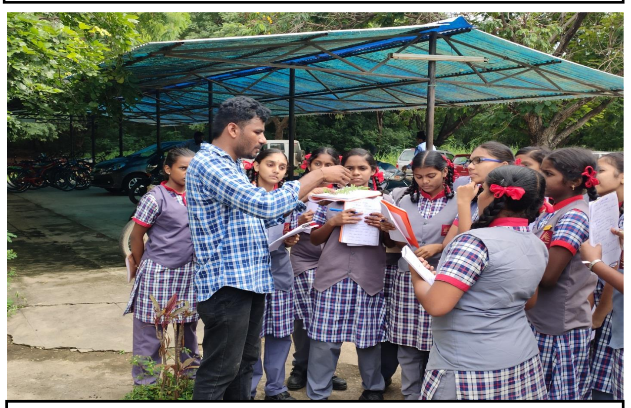
IFB Staff explaining about the Herbarium preparation to Students of KVS, Gachibowli